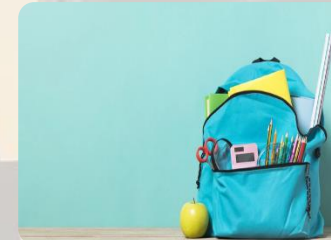
Bildung und Teilhabe